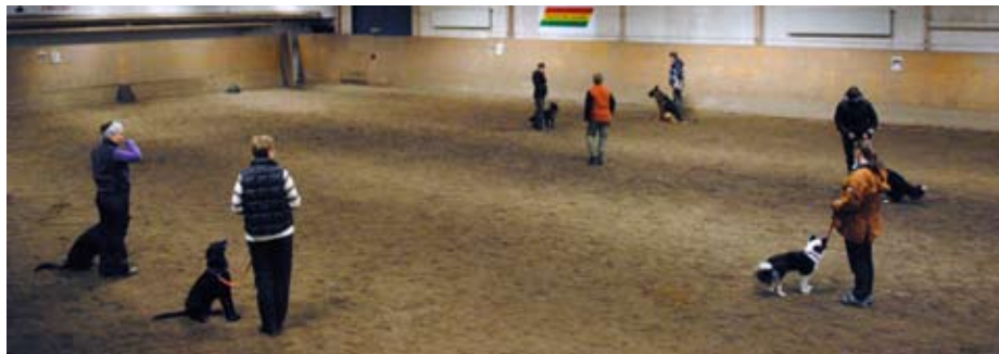
En av vinterns välbesökta ridhusträningar