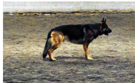
Ett snyggt ställande under inkallning

Under maj och juni kommer vi att ha stugöppet från 19.00 till 21.00. Alla är välkomna att kostnadsfritt delta på de aktiviteter vi arrangerar under dessa kvällar. På hemsidan och på klubben annonseras de olika aktiviteterna.