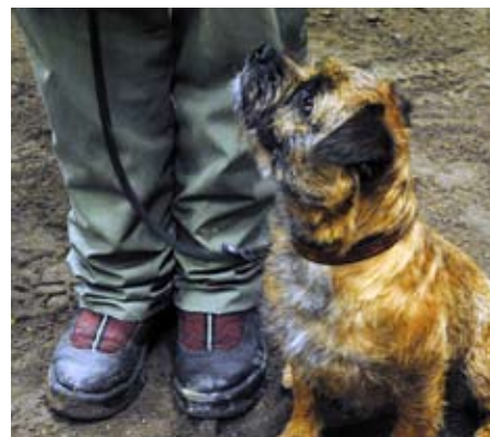
Ådi håller kontakt med matte

Nu kan man själv gå in och ha översikt över sitt medlemskap, ändra uppgifter och skriva ut sitt medlemsbevis, som ersätter medlemskortet. Gå in på www.sbk.nu och klicka på länken till höger medlem online. Viktigt att uppge mailadress, eftersom påminnelse om förnyelse av medlemskap skickas ut per mail istället för brev. Iren kan svara på frågor, iren62voff@hotmail.com.