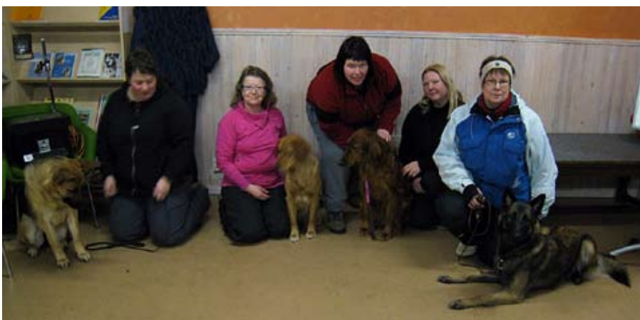
Kämparna på lydnadskursen