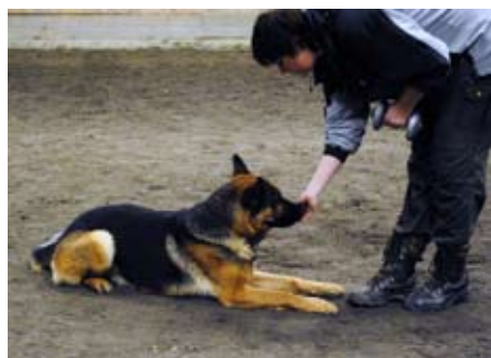
Belöning till en duktig Cox